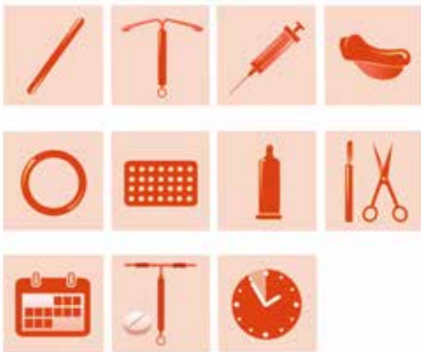
Types of contraceptives

Ka barro wax badan sidii aad u sameyn lahayd galmada ammaanka leh.