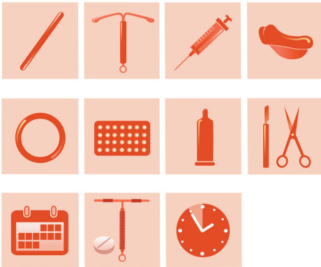
Các biện pháp tránh thai

Tìm hiểu thêm về cách bạn có thể có quan hệ tình dục an toàn hơn .