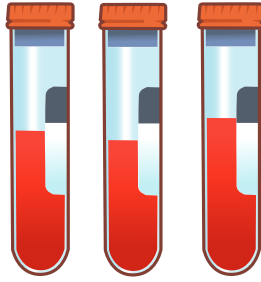
ஒரு ஒற்றியின் மாதிரி