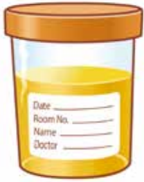
சிறுநீர் (மலம்) மாதிரி

ஒரு STI பரிசோதனைக்கு உங்களிடம் இவை கேட்கப் படலாம்: