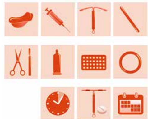
اقسام پیشگیری کننده ها