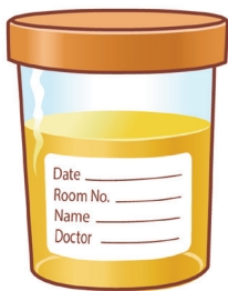
ਇੱਕ ਪਿਸ਼ਾਬ (ਮੂਤ) ਦਾ ਨਮੂਨਾ

ਇੱਕ ਐੱਸ ਟੀ ਆਈ ਟੈਸਟ ਲਈ ਤੁਹਾਨੂੰ ਇਹ ਪੁੱਛਿਆ ਜਾ ਸਕਦਾ ਹੈ: