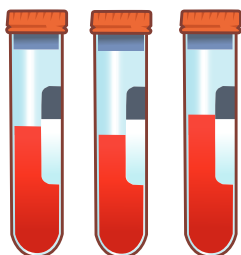
ਖੂਨ ਦਾ ਨਮੂਨਾ

ਬੀਬੀਵੀ ਟੈਸਟ ਲਈ ਤੁਹਾਨੂੰ ਇਹ ਪੁੱਛਿਆ ਜਾ ਸਕਦਾ ਹੈ: